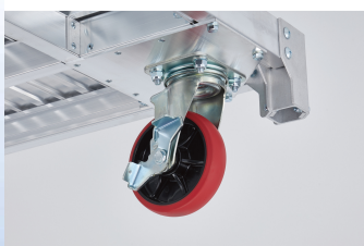
ウレタンキャスター