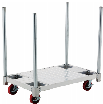
単管パイプ4本差込み