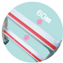
スベリ止め付60mm 幅広ステップ!

昇降時のスベリや踏み外しを 防ぎます。 天板およびステップは60mm の幅広タイプ+樹脂モール滑 り止め付。