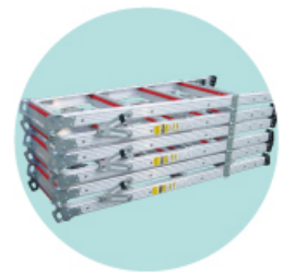
積み重ねてもズレない構造!

各サイズ最下段ステップには 更に補強を加え、脚立のクレ ームで最も多い支柱下端の曲 がりに対して三重の補強を施 しました。